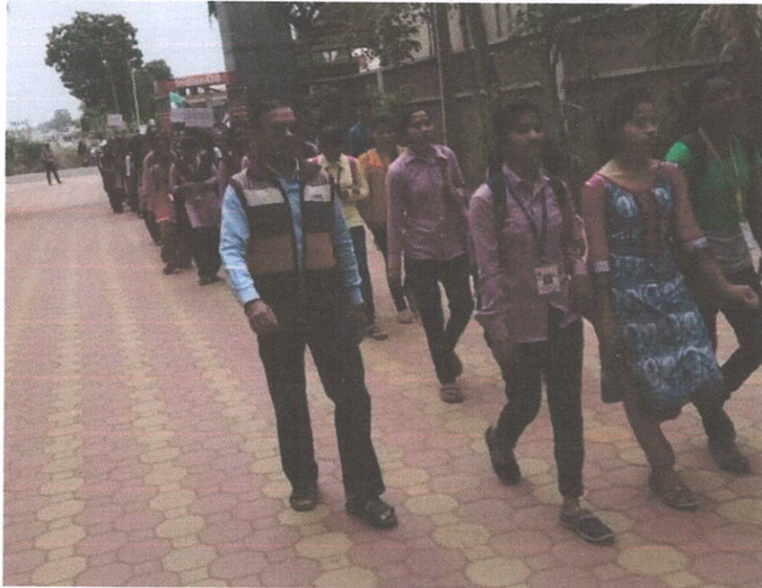
जागतिक एड्स दिनानिमित्त काढलेल्या रॅलीचे छायाचित्र