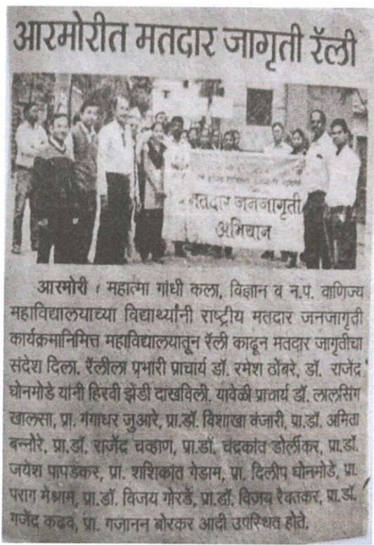
मतदार जनजागृती विषयीच्या वृत्तपत्रातील बातम्या