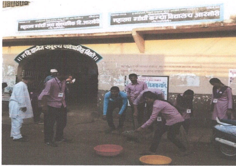
परिसर स्वच्छ करताना महाविद्यालयीन विद्यार्थी