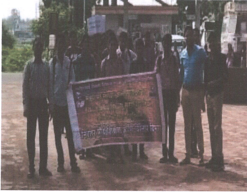
साक्षरता रॅलीचे छायाचित्र

➤ आंतरराष्ट्रीय साक्षरता रॅली : ०८ सप्टेंबर :-